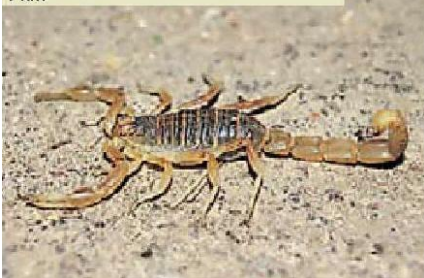
Sáb. 9 de Julho; 10.00 – 13.00 Estação de Biodiversidade (Vale de Poios) 1 km