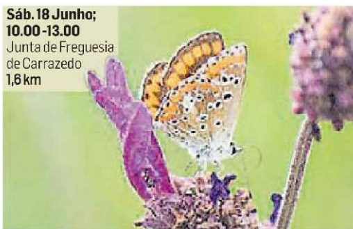
Sáb. 18 Junho; 10.00-13.00 Junta de Freguesia de Carrazedo 1,6 km