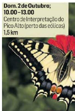
Dom. 2 de Outubro; 10.00-13.00 Centro de Interpretação do Pico Alto (perto das eólicas) 1,5 km