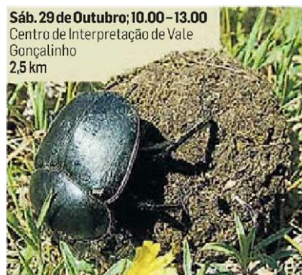
Sáb. 29 de Outubro; 10.00-13.00 Centro de Interpretação de Vale Gonçalinho 2,5 km

› O percurso coincide com o Trilho do Moinho. Com habitat dominante de bosque de azinheira, tem como destaque espécies de flora como o cistus e a aroeira, além de fauna como a borboleta pavão-nocturno e o gafanhoto-ralo.