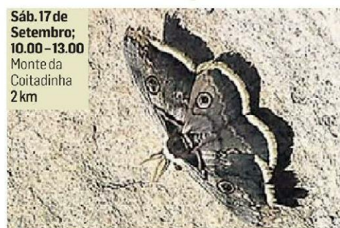
Sáb. 17 de Setembro; 10.00-13.00 Monte da Coitadinha 2 km

› A reserva possui espécies endémicas da Península Ibérica por entre o montado de azibo, como o tamuo. A paisagem é pintada por várias espécies de flores, como a violeta, e rica em insectos como a borboleta-prateada e os gafanhotos.