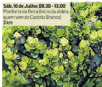
Sáb. 16 de Julho; 09.30-13.00 Monforte da Beira (início da aldeia, quem vem de Castelo Branco) 3 km

› Aqui vai encontrar uma comunidade de borboletas muito rica, com cerca de metade das espécies que voam em Portugal. Destaque para as borboletas aricia-da-risca-branca, erebia e lucina, muito raras no País.